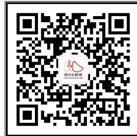
“中国肺功能联盟”微信公众号 微信号：fgnlm_cn

国家呼吸系统疾病临床医学研究中心 国家呼吸疾病医疗质量控制中心 中国医师协会呼吸医师分会肺功能与临床呼吸生理工作委员会 中国肺功能联盟