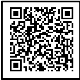
“扫一扫” 在线查看会议及报名