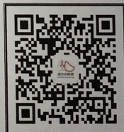
“中国肺功能联盟”微信公众号 微信号: fgnlm_cn