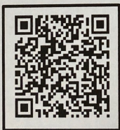
肺功能会议系统 在线查看会议及报名