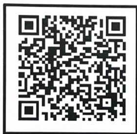
“扫一扫” 在线查看会议及报名