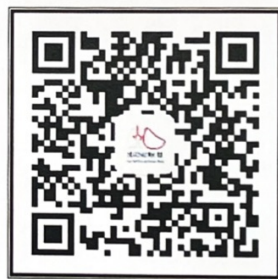
“中国肺功能联盟”微信公众号 微信号：fgnlm_cn