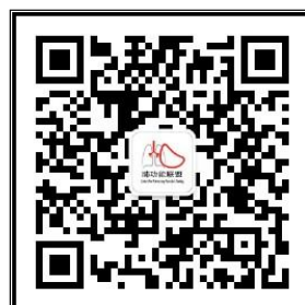
“中国肺功能联盟”微信公众号 微信号：fgnlm_cn